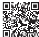
図 賃上げ促進税制